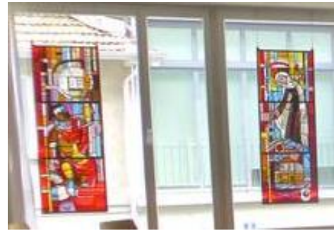
Saal-Fenster im Katholischen Studentenhaus, Herberggasse 7, 4051 Basel